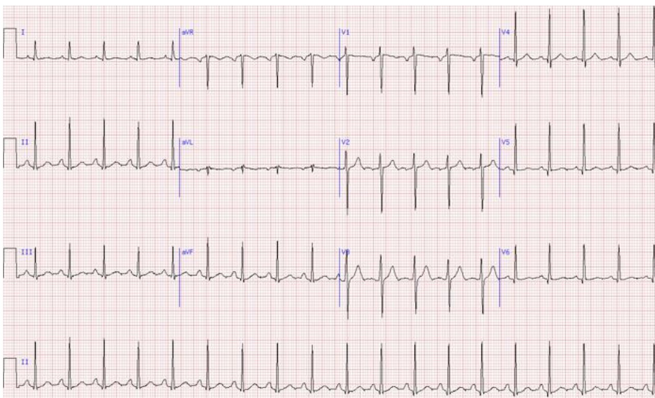
Рисунок 3. Синусовая тахикардия, ЧСС 110